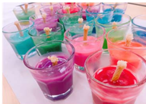
廃油を使ったエコキャンドル