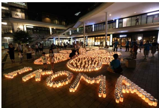
昨年のピース・キャンドル・ナイト in いこま

「平和な日常のために私たちができること」をしっかりと考え、地球環境や平和な世界のために行動する契機となることを目的としています。