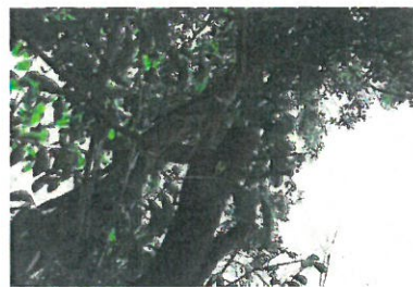
敷地外に伸びた枝の剪定