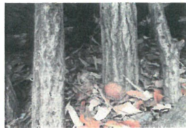
美味しそうなシイタケ