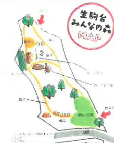
色あせていた森の図面の貼り替え