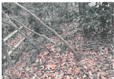
倒れた樹木を起し、支柱を設置