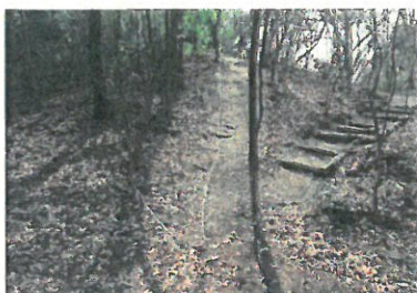
整備後のロープのぼり場