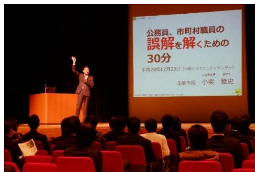
昨年の市長アピールの様子

生駒市の概要を紹介するとともに、市長や現場で活躍する市職員が生駒市役所の仕事の内容ややりがい、職場の雰囲気などを直接伝えます。