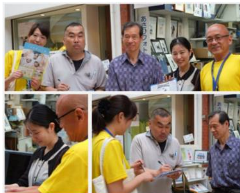
びっくり通り商店街で出前受付実施