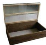
バクテリアdeキー口

電気等を使わず土の中のバクテリアで、生ごみを分解するキー口を市民に対してPRする。