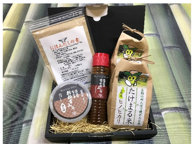
(生駒のおかずセット) 寄附金額1万円