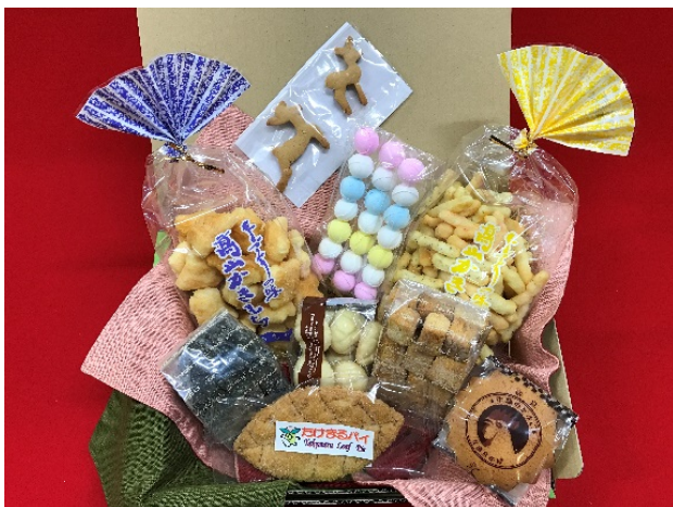
(生駒のおかしセット) 寄附金額1万円

また、受付期間も7月1日から9月30日まで(配送11月)に加え、10月1日から12月31日まで(平成30年2月配送)を追加し、期間を倍増します。