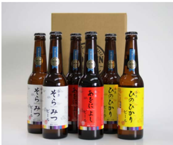
ゴールデン ラビット ビール

生駒市にある地ビール会社「ゴールデンラビットビール」の奈良県産ひのひかりのお米で作られたビールをはじめとするクラフトビール、工具箱で有名なメーカー「リングスター」の自動車のバンパー素材で作られた強くて軽い工具箱、作業工具箱、脳ドックやミニドックなど医療関連品、人気の茶釜を 3 本組み合わせたセットなど新たに追加し、114 品目に充実を図ります。