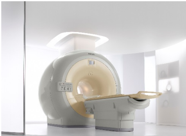
白庭病院 日帰り脳ドック 寄附金額9万円