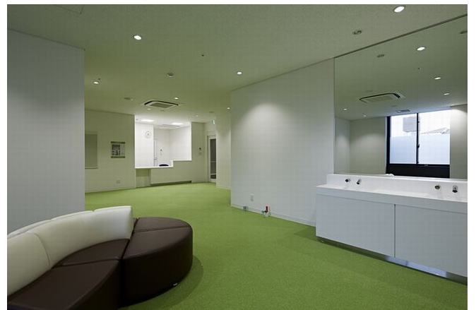
生駒市立病院 ミドック がん早期発見コース 寄附金額9万円