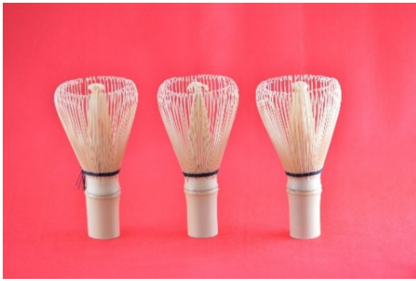
奈良県高山茶釜生産協同組合 (茶釜3本セット) 寄附金額2万5千円