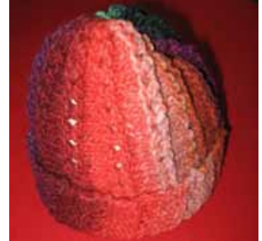
カラフル帽子を作ろう

▼ 対象 市内に住む小学生と その保護者 ▼ 時間 14時～15時 ▼ 指導 生駒市茶道協会と奈 良県高山茶釜生産協同組合 の皆さん ▼ 定員 10組程度(抽選制) ▼ 費用 無料 ▼ 編物体験 ▼ 対象 編み物の初心者 ▼ 時間 14時～16時