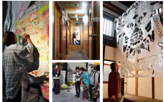
◇写真は昨年の会場の様子です。