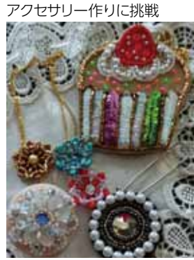
アクセサリー作りに挑戦