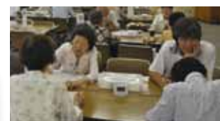
受講者1～2人に、学習支援ボランティアが1人付き添います。