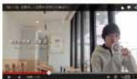
採用PR動画も放映中