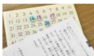
くもん学習療法センターの教材を使用