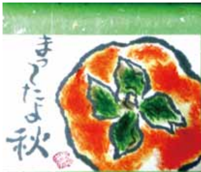
オリジナルの絵手紙を作ろう

年齢、電話番号を明らかに して、9月24日(木)(必着)ま でに消費生活センター(〒 630010257、元町1丁 目6-12、生駒セイセイビル、 ☎73・0550、☎73・05 51、✉consumer@city.k oma.lg.jp) ▼ 手作り紙講座 ▼ とき・ところ 10月6日(火) 13時～14時30分、図書会館 ▼ 内容 1枚のはがきに思い を込めて、素朴で温かな絵手 紙を作りませんか。 ▼ 必要品 筆ペン1本、水彩 絵の具か顔彩、水入れ(プリ ンカップなどの代用も可)、 ポケットティッシュ ▼ 定員 20人(申込順) ▼ 費用 1944円(別途材 料費300円を当日持参) ▼ 申込み・問合せ 9月15日(火) 10時から直接費用を持って 図書会館(☎75・5303)。 定員に空きがあれば9月15 日11時から電話受付可