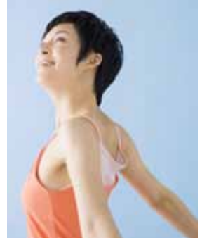
身体を動かしてみませんか

▼とき・ところ 10月10日・17日・31日、11月14日・21日・28日、12月5日・12日(いずれも土曜日)、10時～11時30分、南コミュニティセンター