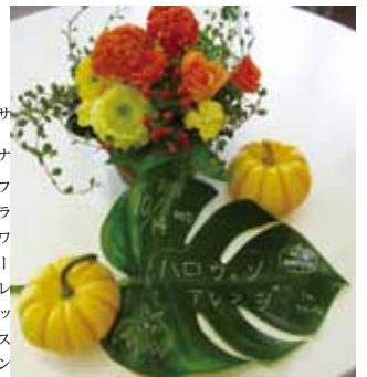
ハロウインを生花で彩ろう