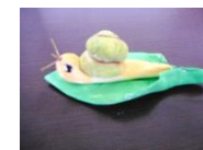
紙粘土のかたつむり

何よりも大切にしている事は、参加者に季節感を感じてもらうことです。そのために一緒に飾る小物も手づくりします。梅雨時期にはかたつむり、お正月には小さな獅子舞など、細かい手作業になりますが、みなさんの喜ぶ顔を想像しながら、頑張って準備します。