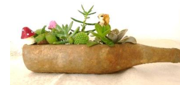
多肉植物の寄せ植え