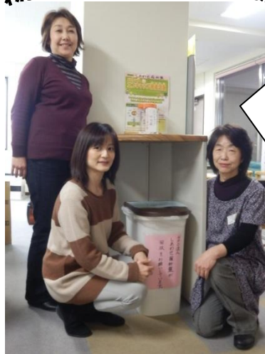
しあわせ羅針盤のみなさん

分別収集することにより、 環境への配慮にもなります。 ぜひ、回収にご協力ください！