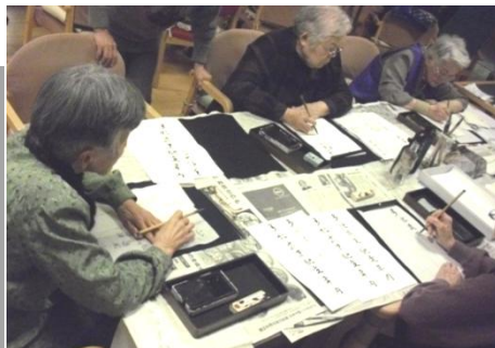
デイフロアの一角で、机を囲んで

デイサービスの趣味活動の時間に、「書道」を担当。土曜の午後一時間、高齢者と一緒に筆を持ち、書くことを楽しみながら、時には、さりげなく上達のアドバイスもされています。自宅で、参加者一人一人の好みの字体に合わせた題材を考えたり、季節に合った言葉を選び、お手本を書いて準備しているそうです。