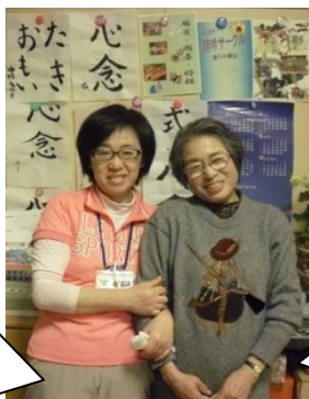
皆さんの力作の前で