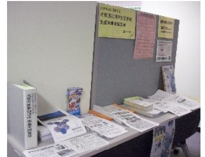
市民活動推進センターららポート 〈支援対象登録団体コーナー〉