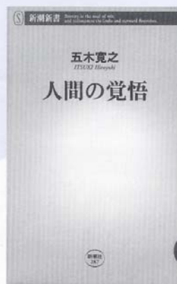
「人間の覚悟」 五木寛之 著 新潮社