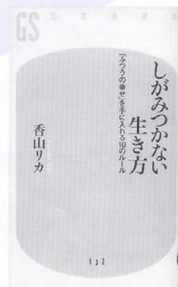
「しがみつかない 生き方」 香山リカ 著 幻冬舎新書