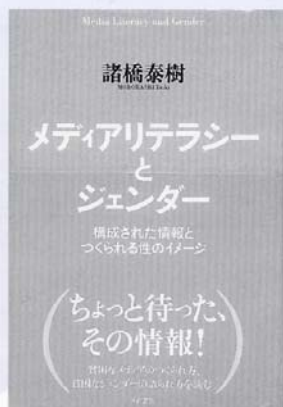
「メディアリテラシー とジェンダー」 諸橋泰樹 著 現代書館