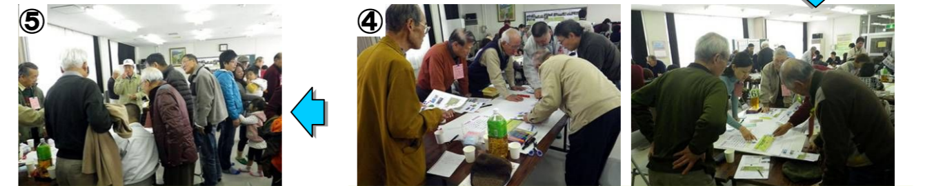
各グループの結果を確認