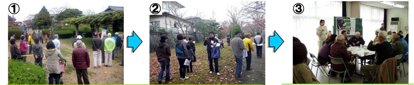
まずは、南と北の緑道に分かれて現地をチェックしました。

日時：11月24日(土) 10:00~12:00 場所：花の広場・森の広場→あすか野自治会館