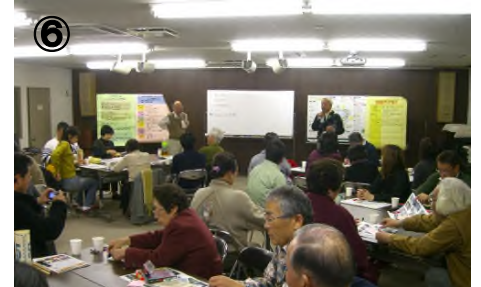
④ 最後に結果を確認しました 気になる結果は次ページから！