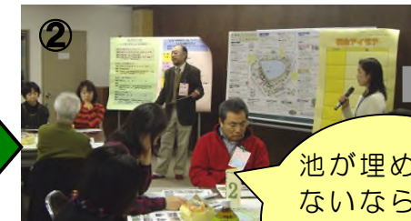
② 前回の内容を振り返りました