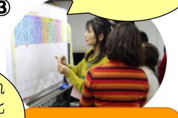
③ 公園で大切にしたいことについてシール貼りアンケートをしました