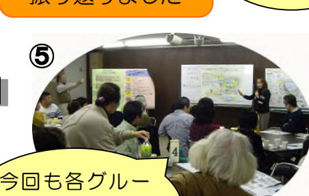
⑤ 今回も各グループの結果を発表しました！