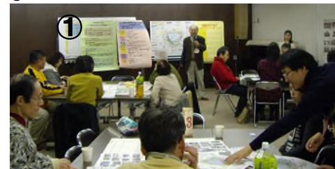
① 今回も多くの参加がありました