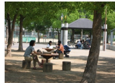
テーブルベンチを置く