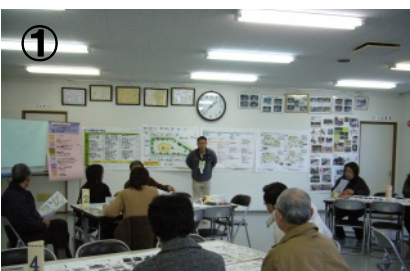
① 前回のおさらいからスタート