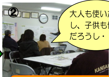
② 3つの計画案「大人の公園」「子供の公園」「大人+子供の公園」から今回の検討のたたき台を選びました