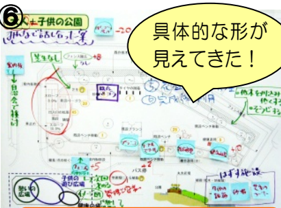
③ 具体的な形が見えてきた!