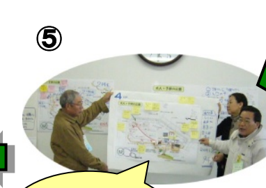
④ 大人が使える公園がいいね