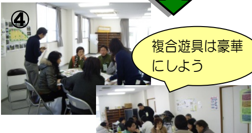
⑤ 複合遊具は豪華にしよう