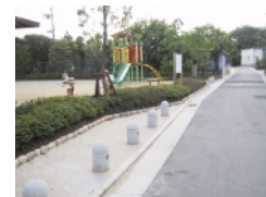
外周の植込みを低くする