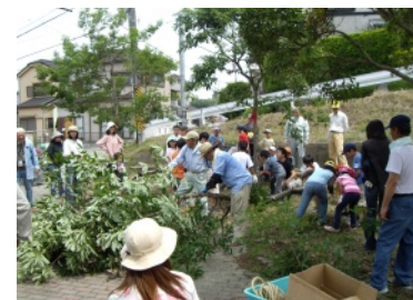
みんなで不要な樹木を切る