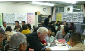
②利用方法を再検討