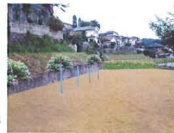
児童の遊び場から奥のイメージ