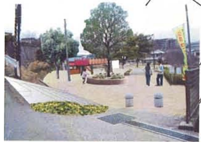
入口広場のイメージ