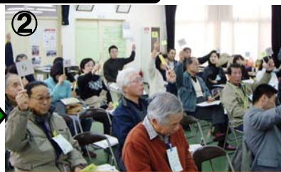
提示された計画案について 意見交換