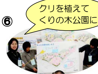
クリを植えて くりの木公園に