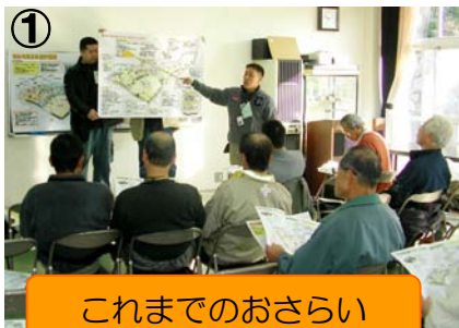
これまでのおさらい