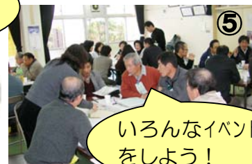
いろいろなイベント をしよう!