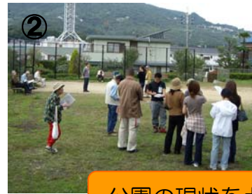
② 公園の現状を点検