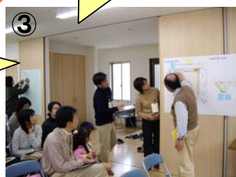
③ 他の公園を考えよう