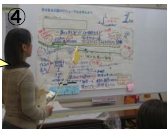
④ 各グループの発表