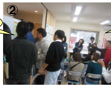
② 改修ポイント シール貼りアンケート