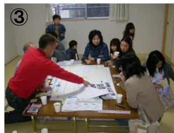
③ グループで具体的な計画のアイデアの話し合い