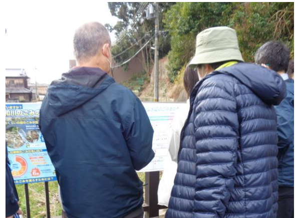
東生駒川でのモニタリングの様子

会場で、参加者の方々に目立ったごみやごみを減らすための効果的な取り組み、マイバック・マイボトルの使用についてのモニタリング調査を行いました。生駒市でのモニタリング調査の結果は、以下のとおりです。ご協力いただいた皆様、ありがとうございました。