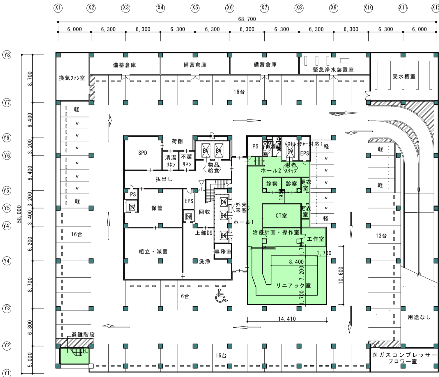
地下2階平面図 1:400 (平成24年12月時点)

リニアック室の追加 (320.29m 2 ) リニアック室 152.64m 2 (14.4m × 10.6m) 診察室 17m 2 (8.5m × 2室) CT室 29.2m 2 治療計画・操作室 23.12m 2 その他ホール及び諸室