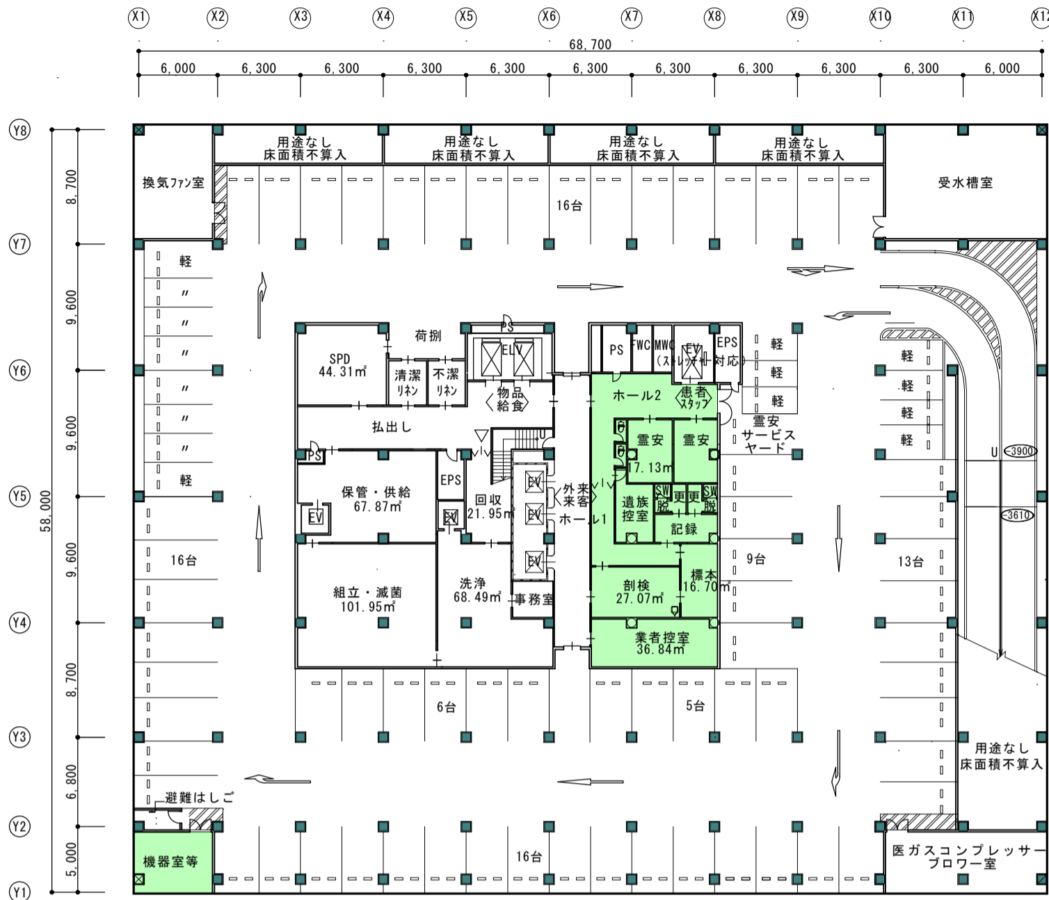
地下2階平面図 1:400 (平成24年9月時点)