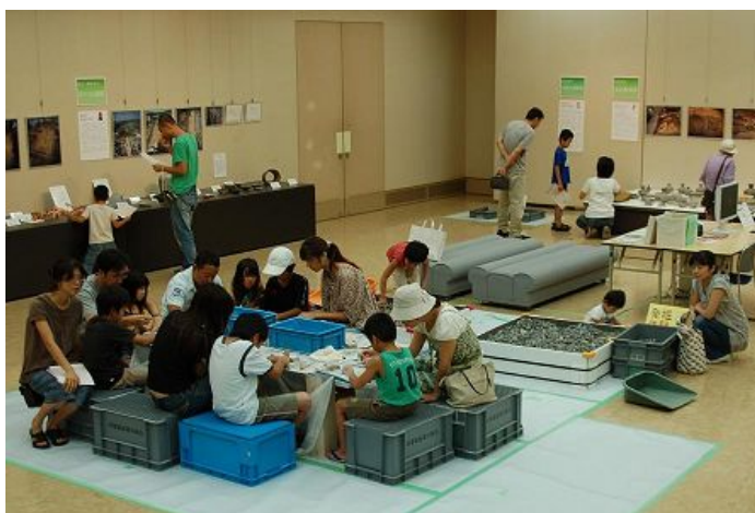
「ワクワクドキ土器！？はっくついこま」

生駒市では、平成21年度から埋蔵文化財活用事業として、須恵器窯跡や竹林寺古墳等市内遺跡から出土した埋蔵文化財の展示会「ワクワクドキ土器！？はっくついこま」を夏休みに芸術会館美楽来で開催している。展示だけではなく、発掘体験・勾玉作りコーナーを設け、子どもたちや保護