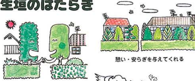
境界の役目をする