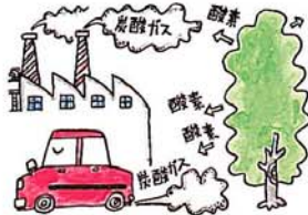
空気をきれいにする