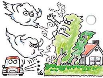
防風・防音・防塵の効果がある