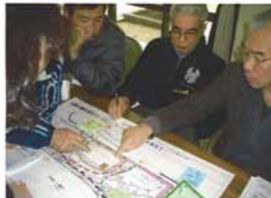
光陽台中央公園を地域の大人と子どもが楽しく集える公園に育てたいね！