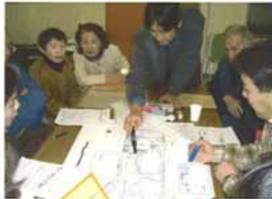
公園の未来と目標を考えよう！