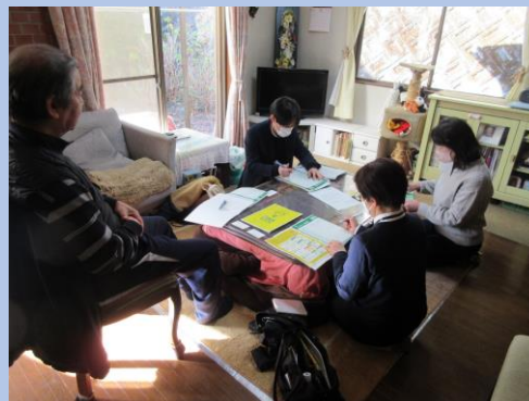
本人・家族アセスメント