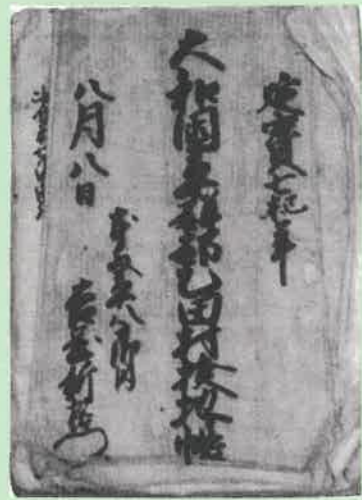
検地帳 (江戸時代中期)