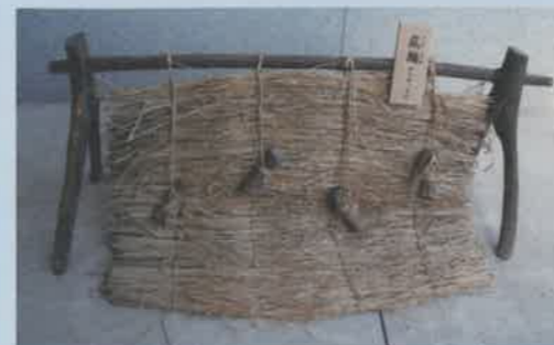
(こもあみぎ) 菰編機