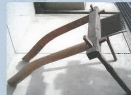
(せんばこ) 千歯扱き