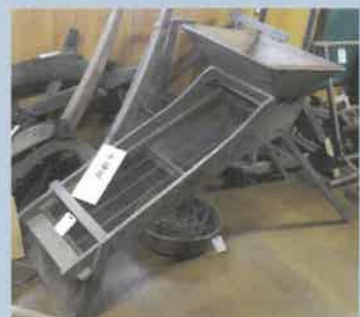
(せんごくどおし) 千石籾