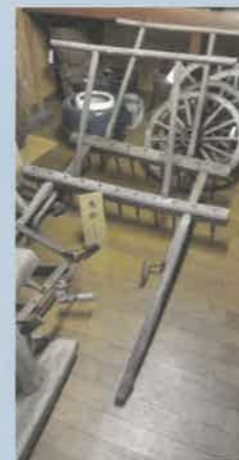
(まんが) 馬 鋤