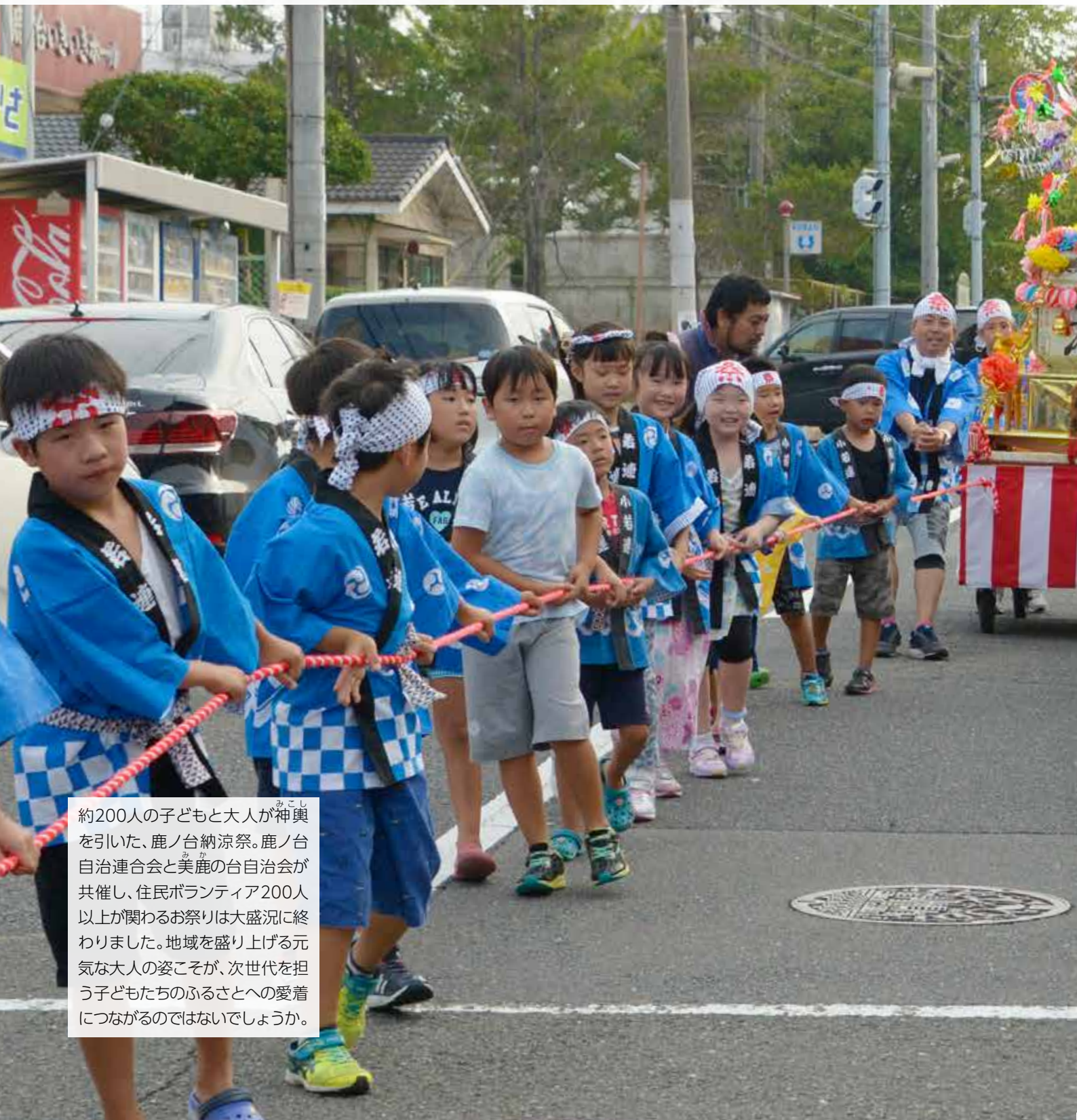
約200人の子どもと大人が神輿を引いた、鹿ノ台納涼祭。鹿ノ台自治連合会と美鹿の台自治会が共催し、住民ボランティア200人以上が関わるお祭りは大盛況に終わりました。地域を盛り上げる元気な大人の姿こそが、次世代を担う子どもたちのふるさとへの愛着につながるのではないのでしょうか。

全国各地で高齢化するニュータウンが問題になっています。悲観し、誰かが動くのを待っているだけでなく、住民が手を取り合い主体的に盛り上げることが解決の第一歩。そう、まちのエンジンはそこで暮らす人たちなのです。