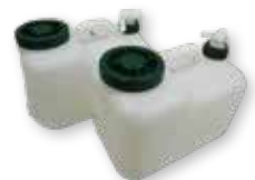
備蓄・給水に使える ポリタンク

しています が、数に限 りがありま す。水は重 いので、容 器をのせる キャリアートなどがあれば運 びやすいです。