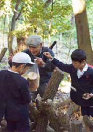
ECOKA委員会が栽培した椎茸を狩る体験を小学生向けに実施