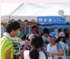
いこまんどこまつりで 利き水コーナーを出店