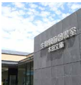
生駒駅前図書室の入口に「木田文庫」と書かれた看板を設置

例えば、「熱中症から子どもを守る 小中学校エアコン設置サポートコース」。熱中症対策は子どもへの命に関わる差し迫った課題ですが、市内の全小・中学校にエアコンを設置するには約15億円の費用が必要です。本市の財政状況では、予算や事業の見直しなどを行っても予算の確保が困難なため、今年度から寄附金の使い道に設定し、寄附を募っています。