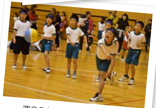
渾身の力で投げるドッジボール