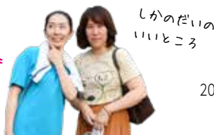
しかのだいのいいところ