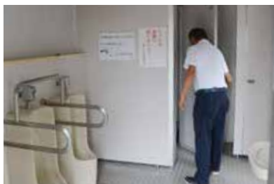
車から降りて公園のトイレに立ち寄り、安全を確認。汚れていれば清掃をすることも