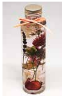
オリジナルのハーバリウムが作れます

あじさいの押し花とプリザーブドやドライフラワーを使って、かわいいピンク色のハーバリウムを作るレッスン