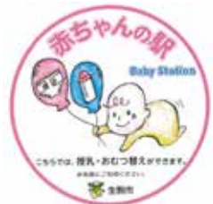
▲赤ちゃんの駅はこのステッカーが目印

外出中におむつ替えや授乳ができる無料の施設「赤ちゃんの駅」を市内公共施設や駅、商業施設などに設置しています。ベビーベッドやおむつ交換台などおむつ替えができる設備や、プライバシーが確保されたところでソファや椅子に座って授乳できる設備があります。気軽に利用してください。