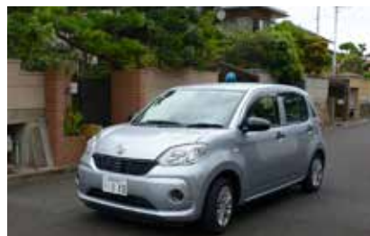
自治連合会で所有する「青パト」。鹿ノ台を5つのルートに分けて巡回しています

「青パトで走ることが、犯罪の抑止力になるんです。自分たちのまちの安全は、自分たちで守ります」