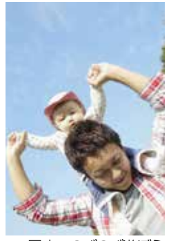
園庭でのびのび遊ぼう