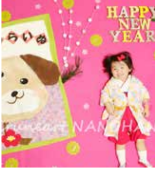
普段とは違った一瞬を切り取るう

— 兄弟姉妹で写る場合は 一人1080円が別途必要。 レンタル衣装は1着1000 円です。