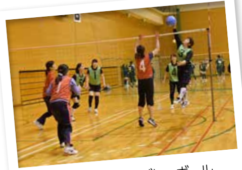
白熱するソフトバレーボール