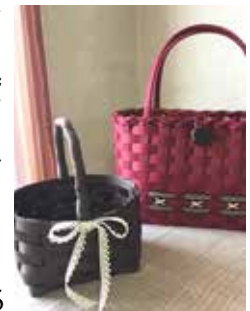
オリジナルのかばんを 作って出かけませんか

▼申込み・問合せ 9月25日(火) 〜30日(日)にファクスかメー ルに郵便番号、住所、氏名、 電話番号、講座名を書いて 芸術会館美楽来講座受付係 (☎74・1101、☎74・12 20、✉miraku-info@ikom ashi-sg.jp)