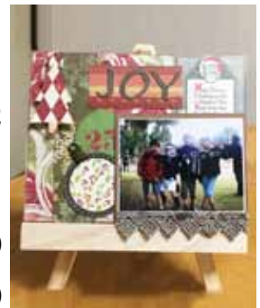
写真をかわいく飾ろう