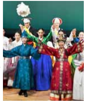
韓国の文化を生駒で体感

「歴史の風入場券希望」係(〒630-0135、南田原町1102-44、☎79-1420、✉entry.narabunka@