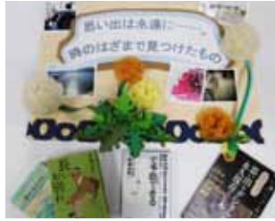
思い出、記憶をテーマにした本が並びます

また「記憶」には思い出に残るものもあれば、失われるものもあります。記憶障がいや認知症による記憶喪失がテーマの小説や、認知症予防に関する本も取り揃えてお待ちしております。