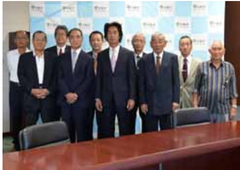
農業委員会委員の皆さん