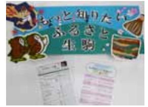
生駒のことを知る本が盛りだくさん

私たちが暮らす生駒について、もっと知りませんか。生駒の歴史や文化にまつわる本を集めたコーナーを市内5図書館・室に新設しました。同コーナーには「歴史」「自然・地理・地図」「民俗(祭り・伝統食・芸能・信仰)」「神社やお寺・文化財」「遺跡」「高山茶せん」などを調べる際に役立つ本をまとめた《なるほど!生駒》リーフレットも設置。子ども向けに分かりやすく書かれた本を集めた《なるほど!いこまキッズ!》リーフレットもあります。