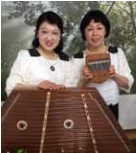
音紡ぎユニットトひだまりによるハンドベル・シター演奏