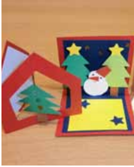
飛び出すカードを作ろう