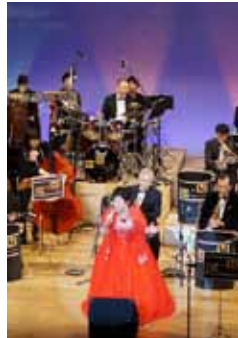
ジャズやラテンを楽しもう