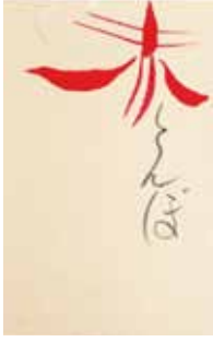
好きな季節の言葉を筆ペンで書こう

▼申込み・問合せ 11月21日(火)~26日(日)にメールかファクスに郵便番号、住所、氏名、電話番号、講座名を書いて、芸術会館美楽来講座受