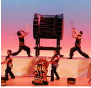
生駒山麓太鼓の演奏が楽しめます

▼ 費用 1000円 ——入場券は11月12日(日)10時から、北コミュニティセンター I S T A はばたき、たけ