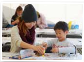
家族で楽しめるコーナーがたくさん。緑に囲まれて遊ぼう!

後援: (公財) 奈良県緑化推進協会 このイベントは同協会の緑化啓発イベント事業助成金を受けて開催します。