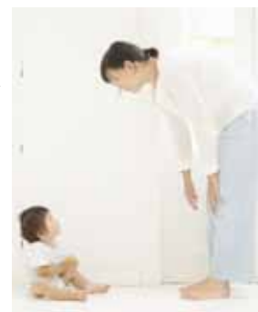
子どもの発達を学びませんか

ため、外出や授業参観・懇談会などのときに子どもを一時的に預けたい人(依頼会員)と預かる人(援助会員)をコーディネートする事業です。