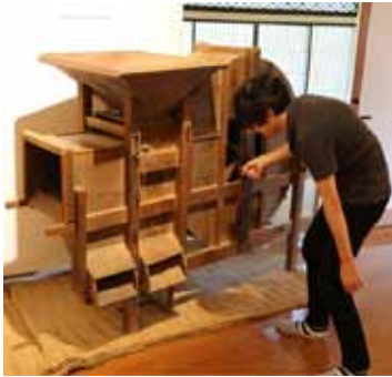
昔の農具を使ってみよう

▼内容 6月に植えた稲を収穫します。昔の農具である千歯扱きや唐箕を実際に使ってみましょう。稲刈りの説明や学芸員のクイズもありま