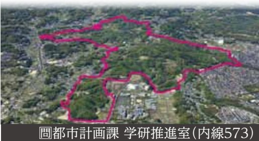
岡都市計画課 学研推進室(内線573)