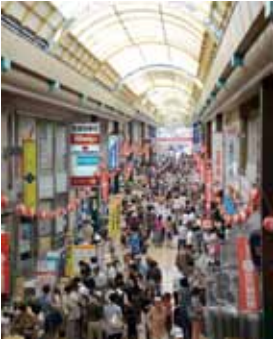
100円でお得に買い物