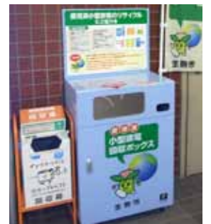
使わない小型家電は回収ボックスへ

2020年に東京で開催されるオリンピック・パラリンピック競技大会の入賞メダルに使用済み小型家電に含まれる金属が使われます。本市は東京2020組織委員会が主催するこの取組に10月から参加。市内6か所に設置している小型家電回収ボックスの活用をお願いします。