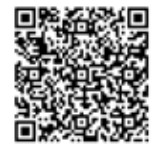
▲アプリの導入はこちらから

問 広報広聴課(内線223)、マチイロの利用やシステムに関することは(株)ホープ(☎092-716-1404)