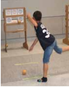
ストラックアウトに挑戦

▼申込み 往復はがき、ファクスかメールで、参加者全員の住所・氏名・ふりがな・年齢・電話・ファクス番号を書いて、10月17日(火)(必着)までに