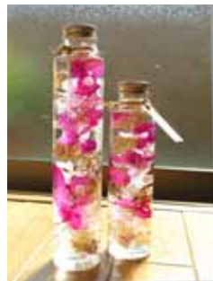
オリジナルのハーバリウムを作ろう