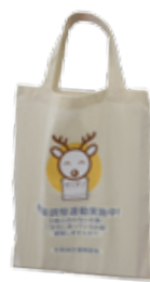
▲残薬バッグを活用しませんか

さらに、普段使っている「服用薬」(薬・サプリメント・健康食品など)をエコバッグに入れて薬局へ持って行くと、薬剤師が残った薬を有効活用できるアドバイスをします。