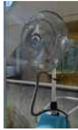
屋外用ミスト付き扇風機