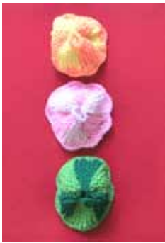
アクリルたわしを作ろう

▼ 申込み・問合せ 往復はがきに参加者全員の住所・氏名・ふりがな・子どもの学年・電話番号を書いて、7月17日(祝)(必着)までに高山竹林園「あみもの教室係」(〒630-0101、高山町3440、☎79-3344、FAX79-9944)