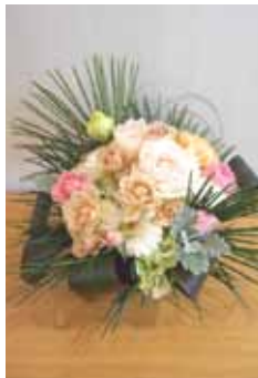
アレンジメントを楽しもう

▶ セミナーとワークショップの申込み・問合せ 7月18日(火)10:00からファクスかメールに郵便番号、住所、氏名、電話番号、セミナーかワークショップのどちらを希望かを書いて北コミュニティセンター講座受付係(☎71-3331、☎71-3351、✉kitakomi-info@ikomashi-sg.jp)