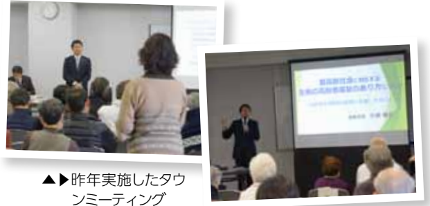
▶▶ 昨年実施したタウンミーティング

生きいきクーポン券が使用できる施設や使い方は、下表のとおりです。タウンミーティングやワークショップで出た市民の皆さんの意見を参考に、種類や使い方などを決定しました。