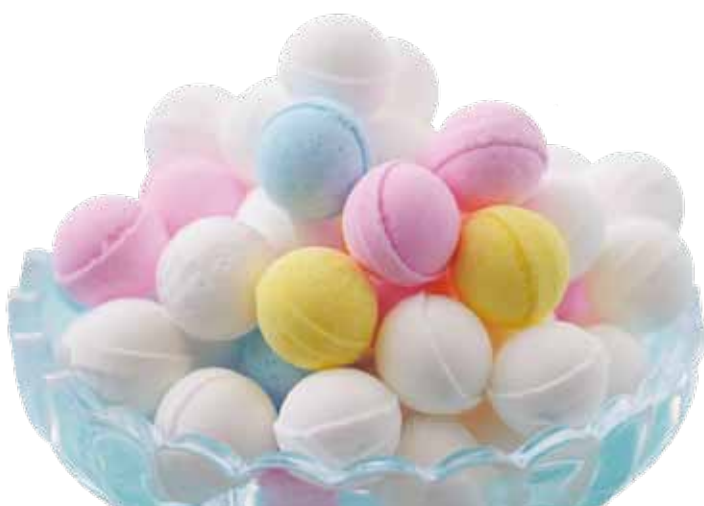
▲毎年大好評のレインボーラムネ 寄附金額に応じて3コースを用意しています

サクッ、ふわっとした食感とカラフルな見た目で幻のラムネと呼ばれるレインボーラムネ。3万円の寄附で選べる720g×8箱セットを今年はセット数を増やして準備しています。その他、1万円の寄附で720g×2箱セット、5万円の寄附で720g×12箱セットもあります。