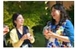
地ビールを飲む参加者

また、茶釜と生駒を本で学んで体験する「お茶会@北分館×茶釜のふるさと」も開催予定。詳しくは6ページをご覧ください。