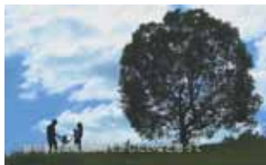
▲昨年映画館で放映したCM