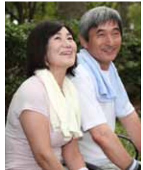
簡単な体操で体を動かそう