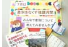
差別について考えよう

▶ とき・ところ 7月8日(土)～8月3日(木)、図書館・図書館北分館・図書館南分館・生駒駅前図書室・鹿ノ台ふれあいホール図書室(鹿ノ台ふれあいホール図書室だけ7月1日(土)から)