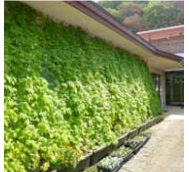
自慢のカーテンを待っています

薦できます(推薦する場合は、事前に「みどりのカーテン」の所有者から了解を得てください)。