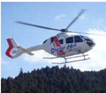
今春運航を開始した奈良県ドクターヘリ