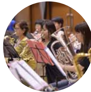
▲誰もが音楽を楽しめる まちへ市民吹奏楽団を結成

返礼品が選べるのは当たり前。本市では、ふるさとの「まちへの恩返し」をキーワードとし、寄附金の使い道に具体的な6つの事業を設定しました。皆さんが「応援したい！」と思う取組を選ぶことができます。使い道に迷った人は「市長におまかせ」コースもあるので安心。皆さんの応援で、生駒をもっと魅力的なまちにしませんか。