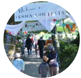
▲約1万人が来場した昨年の IKOMA SUN FESTA