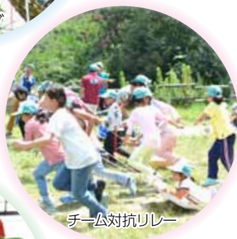
チーム対抗リレー