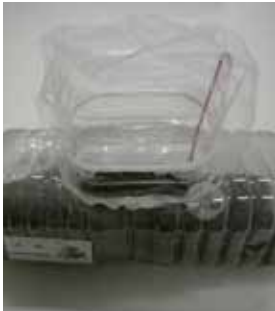
オリジナルの虫カゴで、 スズムシの成長を見守ろう