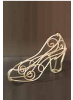
ワイヤーで靴を作ろう