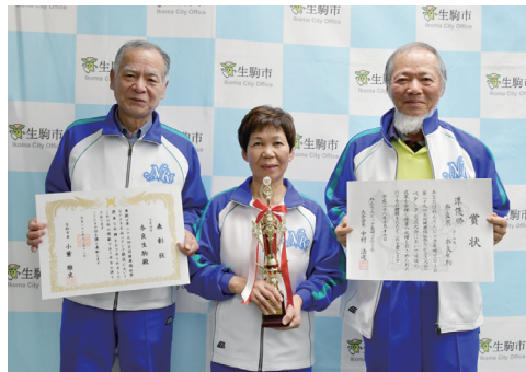
奈良生駒の皆さん

により生駒市の発展と市民福祉の向上に多大な貢献をされた功績を讃え三都住建(株)に、また、ベタランク競技の全国大会で優秀な成績をおさめられた功績を讃え奈良生駒に、市民功労表彰を授与しました。 ▼ 問合せ 秘書課(内線204)