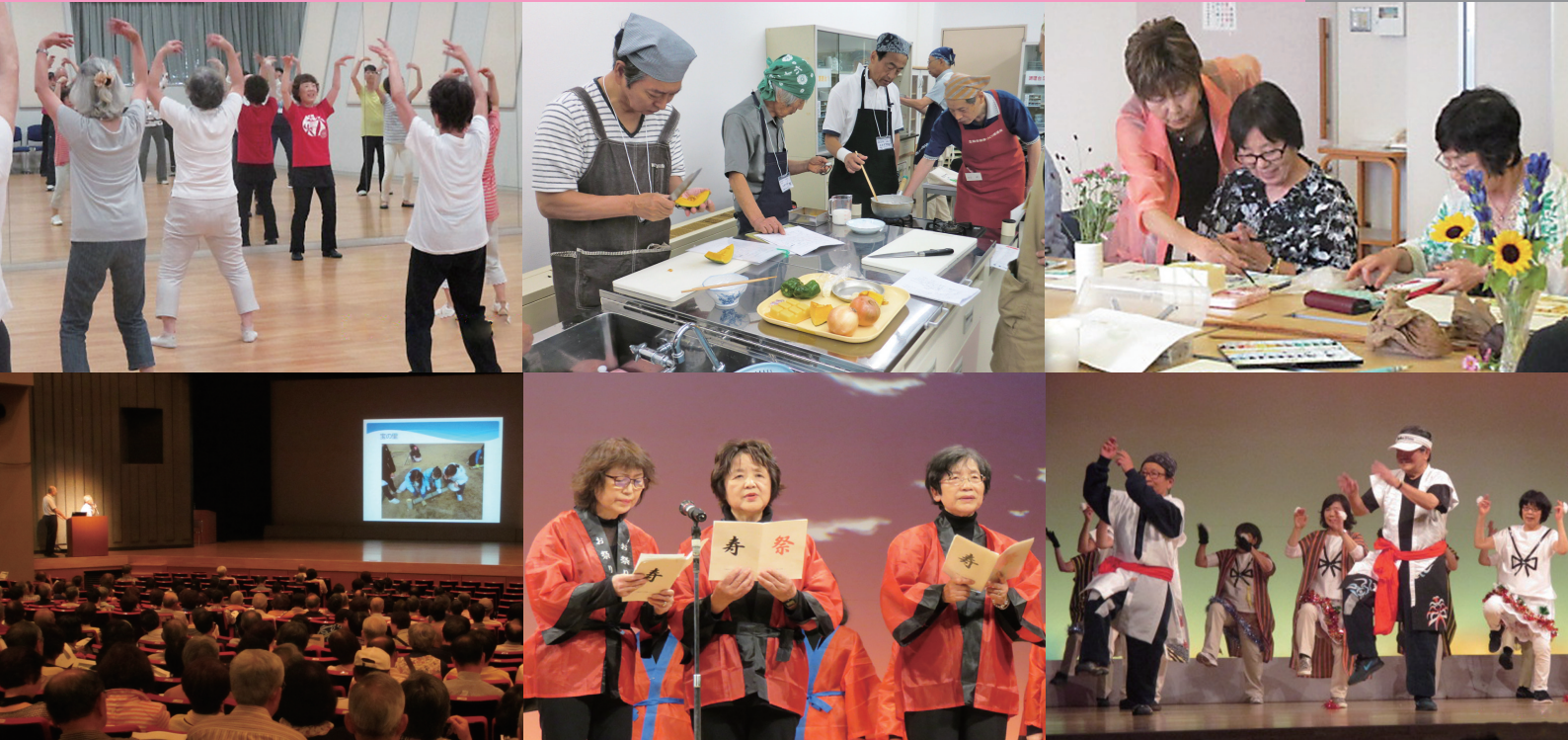
▲(上段左から)レクリエーション体操、クッキング、絵画など10種類からクラブを選びましょう (下段左)教養を高める講演会なども多数開催(下段中・右)寿大学祭で学習の成果や演芸を披露