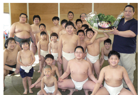
▲まわしをつけて相撲に挑戦