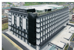
▲東生駒駅から徒歩2分