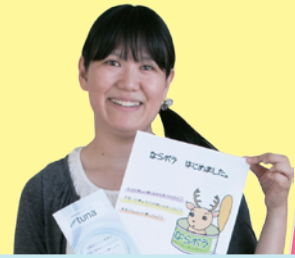
NPO法人 市民活動サークルえん