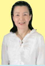
NPO法人 まほろび舞会