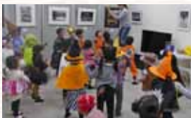
鹿ノ台小学校区で行われたハロウィンイベント