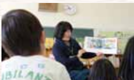
休み時間に子どもたちに読み聞かせ