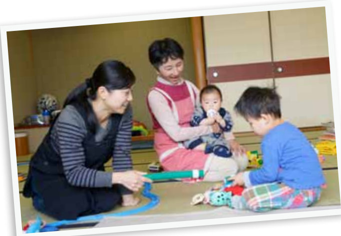
▶託児は公共施設で行います。おもちゃや絵本は市で準備します。

講義や保育実習などを含む全6回の「子育て支援ボランティア講座」。受講後は、市が主催するイベントのお手伝いや託児ボランティアをお願いします。子育て未経験の人もひと段落した人も、いっしょに学んで子育てを応援しませんか。