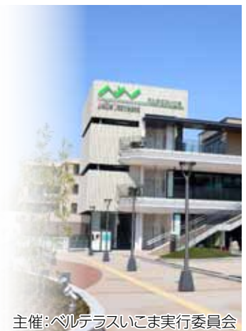
主催:ベルテラスいこま実行委員会