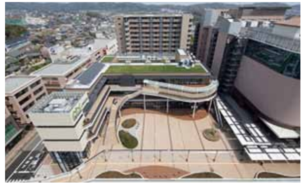
住まい、買い物、医療などを集め、コンパクトで便利なまちを整備