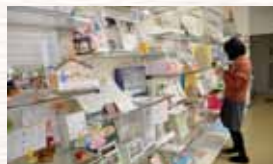
自由に登録団体の情報をチェック