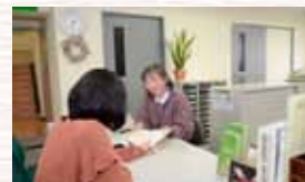
ボランティアコーディネーターに相談