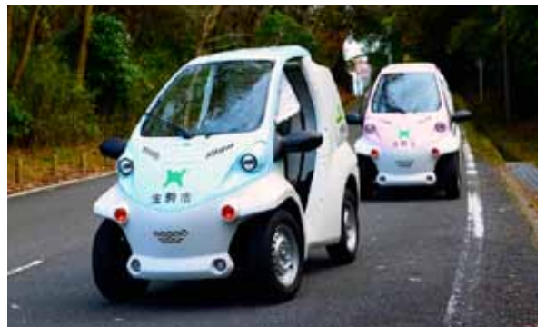
一人乗り電気自動車である超小型モビリティを2台購入