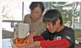
得意分野を生かして洋裁の指導