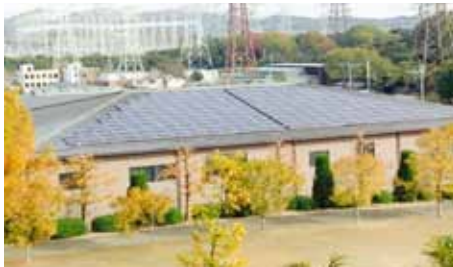
市民エネルギー生駒が運営する市民共同発電所

市民主体の再生可能エネルギーの普及を目指して活動している市民エネルギー生駒による市民共同発電所の2号機(南こども園の屋根)と3号機(小瀬保健福祉ゾーン)が全額市民出資で完成します。