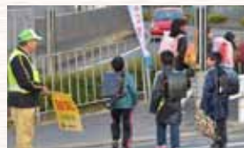
やまびこネットワークのあいさつ運動