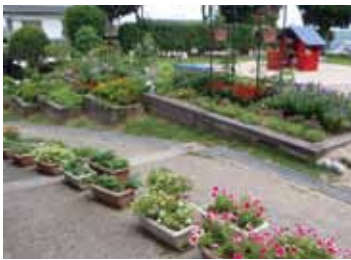
▲宝山寺駅から街並みを見下ろした風景。住宅地や自然などが調和しています。 ◆地域住民が整備した花が並ぶ光陽台中央公園。ほっこりできると評判です。

住んでいるまちの「らしさ」を感じるのには、どんなときですか。季節ごとに色づく通りの並木や家から見える生駒山、特別ではないけれど何か良いなと感じるもの…。人によって感じる、住むまちの特徴「まちの遺伝子」はさまざまです。