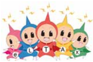
エルレンジャー (eLTAXのイメージキャラクター)

本市は、地方税に関する手続きの一部で、11月25日から電子申告システム「eLTAX」による受付を始めます。従来、窓口や郵便で提出していた書類