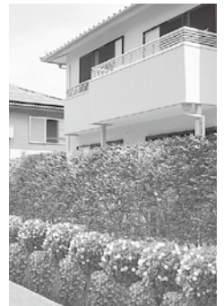
生垣の設置に補助をします

所などの土地を市内に所有するか使用する個人か団体(当該土地の販売を目的とする人は対象となりません)