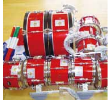
子どもたちが元気に演奏します

本市では平成25年度の(財)自治総合センターが行うコミュニティ事業(宝くじ助成事業)により、奈良佐保短期大学付属生駒幼稚園幼年消防クラブに鼓笛用資器材を整備しました。平成26年生駒市消防出初