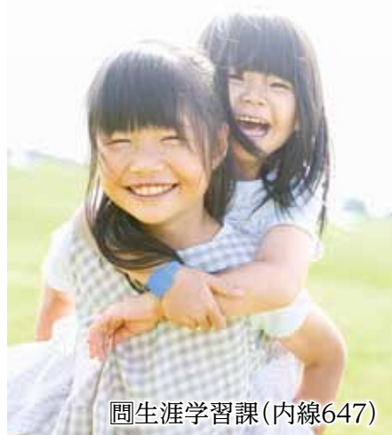
園生涯学習課(内線647)