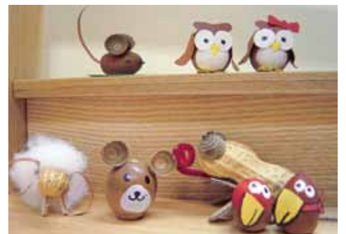
図書室職員といっしょにどんぐり工作♪

◎費用▶無料(申込不要) ◎問合せ▶鹿ノ台ふれあいホール図書室(☎78・9973)