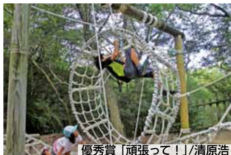
優秀賞「頑張って!」/清原浩