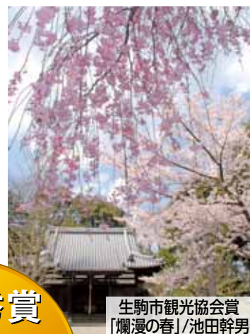
生駒市観光協会賞 「爛漫の春」/池田幹男