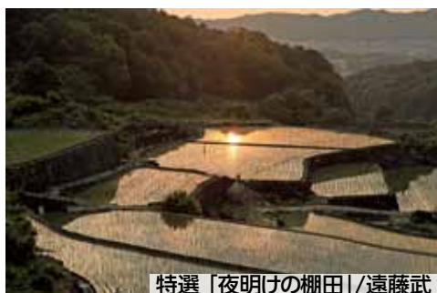
特選「夜明けの棚田」/遠藤武