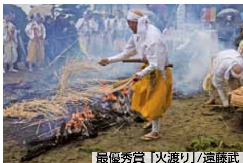
最優秀賞「火渡り」/遠藤武