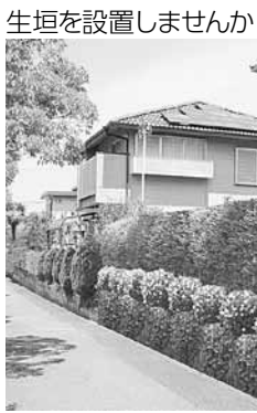
生垣を設置しませんか

▼助成額 植栽費の2分の1(1m当たり5000円が上限)で、ブロック塀などを撤去し生垣を設置する場合は、別途撤去費の2分の1(1m当たり2500円が