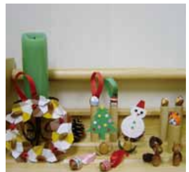
どんぐりで工作を楽しもう

事前に除くことがあります。 ◇一度持ち込まれた本や雑誌は返却できません。残った本や雑誌は処分します。