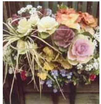
お正月飾りを楽しみませんか?