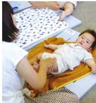
赤ちゃんを絆を深めよう

県社会福祉協議会福祉人材センター介護支援専門員試験係(〒634-0061、橿原市大久保町320-11、奈良県社会福祉総合センター内、☎0744・26・0225)