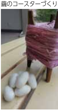
繭のコースターづくり

◎申込み・問合せ ファクスか往復はがきに、住所、氏名、ふりがな、年齢、電話番号(ファクス番号)を書いて、8月15日(金)(必着)までに生涯学習推進連絡会「コースターをつくる」係(生涯学習