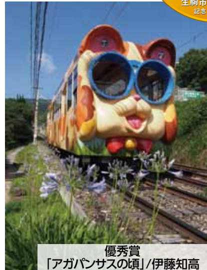
優秀賞 「アガパンサスの頃」/伊藤知高