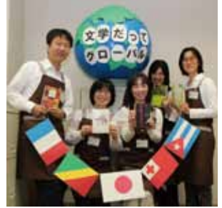
本をきっかけに世界と触れ合ってみませんか。

海外作家の本は読みますか？〈よいもの〉〈ほんもの〉に国境はありません。文化や言葉が違って、同じ人間である限り、人生は、楽しく、つらく、切なく、そして何より愛おしい。「文学は国家の枠を越えてあなたの心に届く！」そんな思いを込めた特集です。あなたの知らない世界のどこかで、あなたによく似た人を見つけ出せるかもしれません。