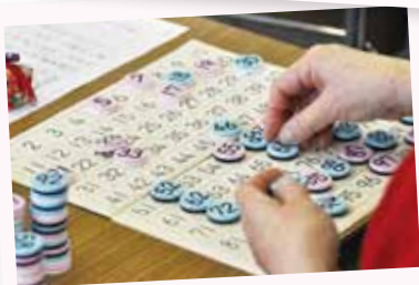
数字を並べたり、簡単な計算をしたり