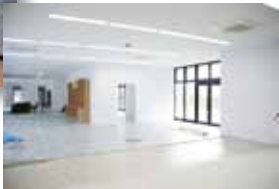
屋外で読書が楽しめるカフェテラスなど、準備が進む生駒駅前図書室。上:外観 右:室内(2月7日現在)