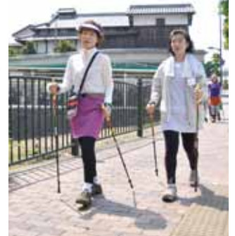
楽しく体を動かそう

◇チケットでそのつど参加(コース別)：11枚つづり1万2000円、5枚つづり6000円