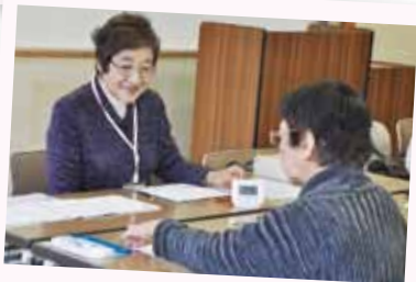
少人数のグループでテンポ良く