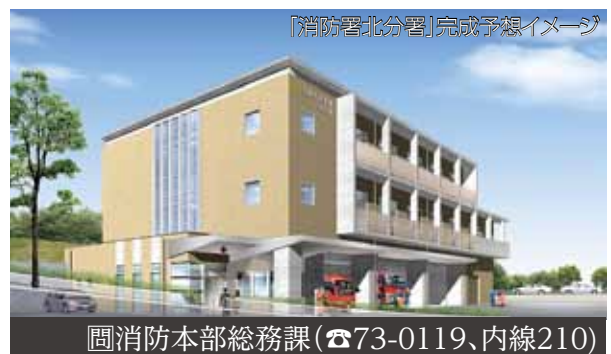
消防防本部総務課 (☎73-0119、内線210)

然に触れながら、普段あまり歩くことのない道を歩きます。上田酒造でお酒のお土産を買うこともできます。