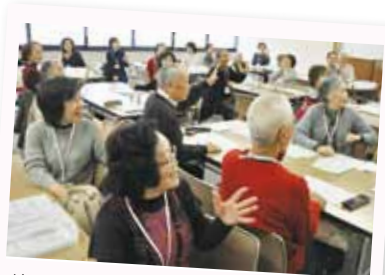
学習前にみんなでゲーム。とっても和やか