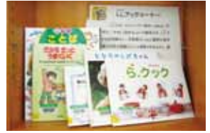
使用する文章や用語の他、レイアウトも工夫されています。

LLブックは誰もが情報を得られるように、読書が楽しめるようにと願って作られた本です。知的障がい、学習障がいなど通常の活字図書の利用が困難な人にも理解できるように、図や写真を多く使うなどの工夫をしています。コーナーには料理の本、災害時に備えるための本などがあります。ぜひご覧ください。