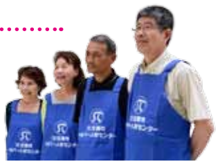
いっしょに働きませんか？

編集と発行/生駒市秘書広報広聴課(〒630-0288 奈良県生駒市東新町8-38 ☎0743-74-1111 FAX0743-74-9100) 印刷/㈱昭文社