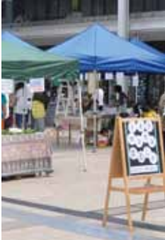
ママの力作がいっぱい

会認定のおもちゃドクター が、壊れたおもちゃを修理 —— 高度な機能のもの、美 術的なものや骨董など、修理 を引き受けられないものもあ ります。