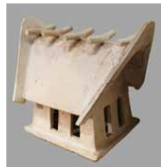
家形埴輪の実物を見よう

古墳時代中期(5世紀中頃)のもので、屋根の上に鰐木(わぶき)のせた立派な埴輪です。