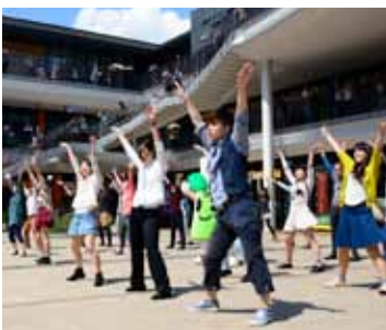
昨年5月にベルステージで行われたフラッシュモブの様子

は、ベルテラス3階の「生駒市アンテナショップおちやせん」で行います。詳しくは、おちやせんホームページをご覧ください。