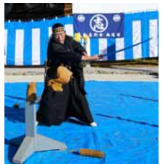
迫力満点の試し切り