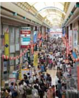
毎回朝から賑わう百円商店街