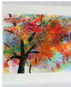
紅葉屏風を描こう

▼申込み・問合せ 10月27日 (火)10時から直接、費用を持 つていただけるホール(☎75- 0101)。定員に空きがあ れば10月27日11時から電話 受付可