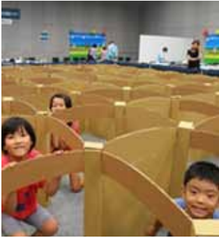
ダンボール迷路で遊ぼう

て、10月20日(火)(必着)まで に男女共同参画プラザ「ダ ンボール工作」係(〒630