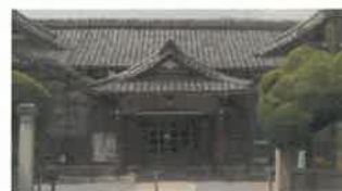
↑郷土資料館計画地