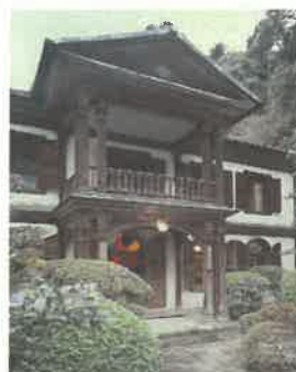
↑重要文化財 宝山寺獅子閣