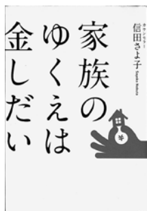
家族のゆくえは金しい 信田 さよ子 著

〈愛と絆〉だけでは乗り切れません。持てる世代の親と、無職の子ども。依存症者とその家族。経済的DV…。リアルな事例から現代日本を浮かび上げらせ、実践的な打開策を掲載。