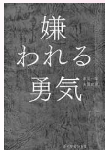
嫌われる勇氣 岸見 一郎 古賀 史健 著

自分の「こころのクセ」を知る。気分と行動の悪循環から抜け出す。呼吸法、睡眠法で身体をリラックスさせる。 —認知療法への待望の入門書—