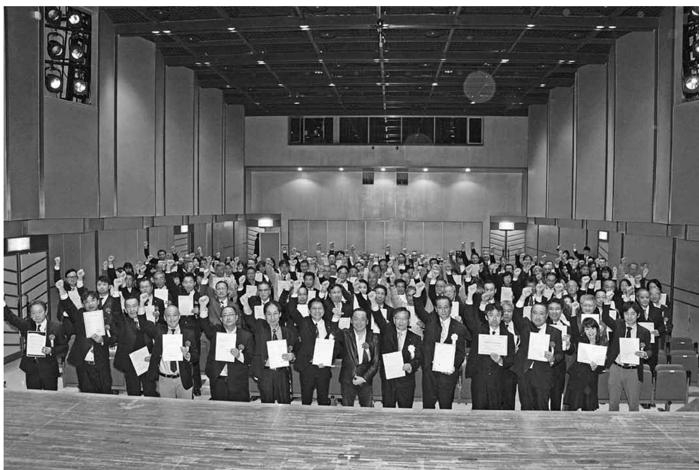
産・官・学をあわせたイクボスの皆さん

ワーク・ライフ・バランスの実現により、仕事と家事育児などのバランスがとれ、子どもを産み育てやすくなることで、日本がかかえている人口減少、労働力不足、長時間労働などの諸問題の解決にもつながり、ひいては社会や経済全体にメリットがあると考えられています。