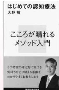
はじめての認知療法 大野 裕 著

結婚してても、子アリでも、最後はひとり。4割が「独居老人」の時代に!! “ひとりの老後を応援する団体”の代表が教える「幸せ老人の生き方」。