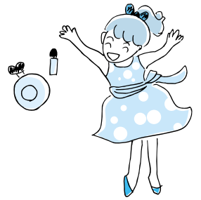
(ダンスをしているとき)