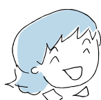
(友達とおしゃべり)