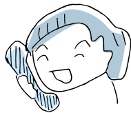
(長電話しているとき)