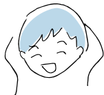
(今日は元気だと思えるとき)