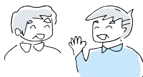
(遠くの兄弟に会うとき)