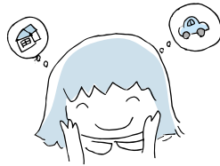
(お金を使う算段をするとき)