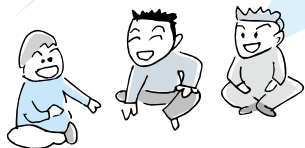
(友達の輪が広がったとき)