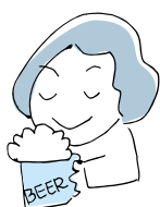
(お酒を飲んでいるとき)