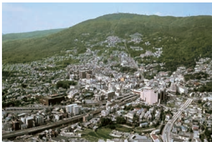
〈景観計画区域（市街地景観区域）〉