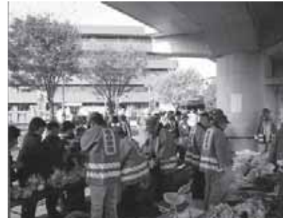
地元野菜の青空市場