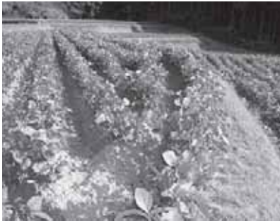
高山町の黒大豆畑