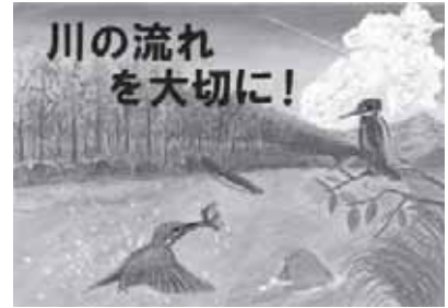
河川愛護啓発絵画 「こどもたちから見た川」