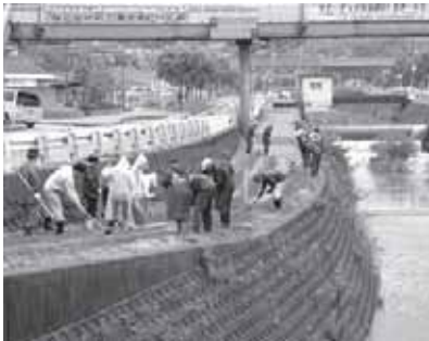
河川敷の美化清掃と花の育成活動