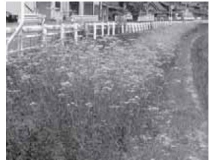
富雄川のオミナエシ