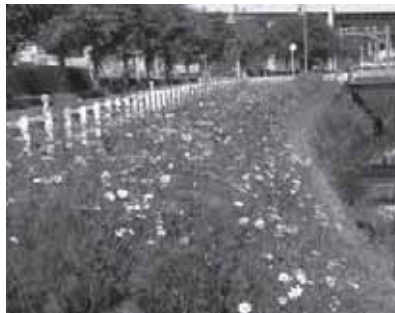
富雄川のコスモス