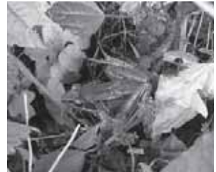
ニホンアカガエル