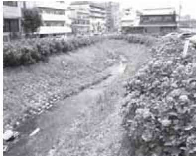
東生駒川のアジサイ