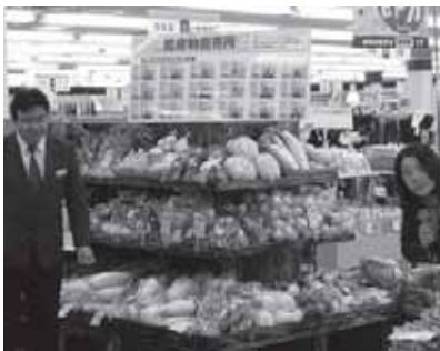
地元野菜の直売コーナー